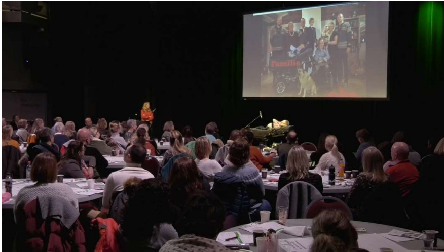
Fra «Hva er viktig for deg»-konferansen i Lillestrøm Kultursenter 23. januar 2020

Denne fagdagen er arrangert av Fagforum koordinerte tjenester og Fagforum forebygging.