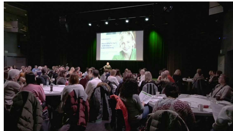
Fra «Hva er viktig for deg»-konferansen i Lillestrøm Kultursenter 23. januar 2020

Denne fagdagen er arrangert av Fagforum koordinerte tjenester og Fagforum forebygging.