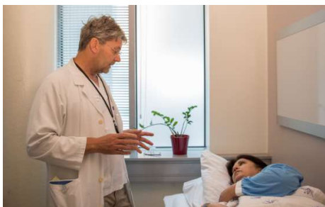
Dialog mellom pasient og lege/hva er viktig for deg?

Vi ønsker å informere deg om hva sykehuset har ansvar for og hva kommune/bydel har ansvar for.