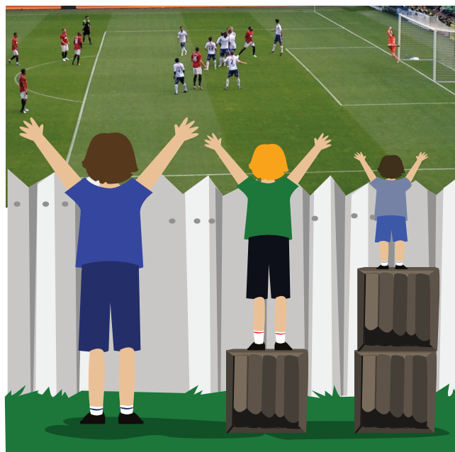
Like tjenester versus likeverdige tjenester

Å ta hensyn til pasientens kulturelle verdier eller preferanser er ofte en litt annen problemstilling. Det kan handle om at pasienten ønsker å bli behandlet av en av samme kjønn, eller at pasienten ikke ønsker å følge medisinske anbefalinger om et bestemt kosthold. Her kan helsepersonell oppleve at deres idealer kommer i konflikt med pasientenes idealer.