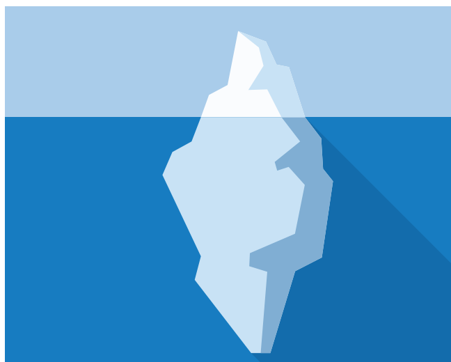
Kultur som isfjell

Vi vet også at kunnskaper og ferdigheter er ulikt fordelt i grupper, eller går på tvers av grupper (som for eksempel etniske eller nasjonale grupper). I dagligtalen bruker vi ofte begrepet kultur på en måte som dekker over disse forskjellene. Vi gjør kultur til en egenskap ved personen eller gruppen, som gjør personen eller gruppen klart avgrenset fra en annen person eller gruppe. Ofte fremheves dessuten våre «positive» egenskaper, som en kontrast til en annen gruppes negative egenskaper. Dette gjør at vi må ha en kritisk omgang med begrepet kultur. I stedet for å se på kulturmøtet som et møte mellom representanter for «kulturer» med bestemte egenskaper, er det mer fruktbart å se på det som et møte mellom mennesker med ulike erfaringer, kunnskaper og ferdigheter. Et slikt kulturmøte kan også skje mellom personer som tilhører samme etniske eller nasjonale fellesskap.